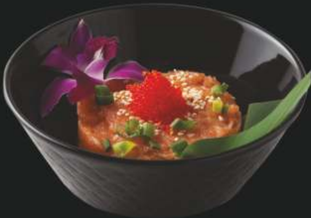
SAKE TATAR 150 g 49 ,- łosoś, por, szczypiorek, sos sojowy, sos chilli, czerwona cebulka, sezam