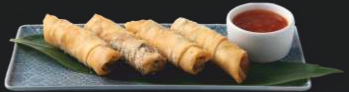
SAJGONKI WARZYWNE 4 szt. 29 ,-