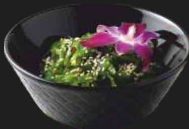
GOMA WAKAME 25 ,- sałatka z trawy morskiej w sezamowym dresingu