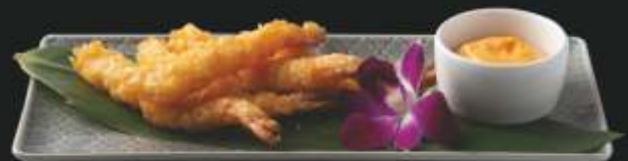
EBI TEMPURA 5 szt. 39 ,- Krewetki w chrupiącym japońskim cieście