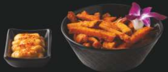
FRYTKI Z BATATÓW 22 ,- z kim-chi mayo