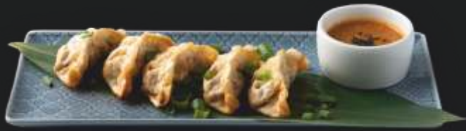
DUCK GYOZA 5 szt. 34 ,- pierożki Gyoza nadziewane kaczką z dodatkiem szczypioru i sosem sezamowym